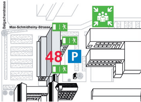
Anmeldung bei der Rezeption, Bau 48, 2. Stock