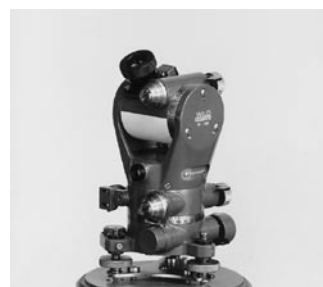
1936 Goniómetro WILD G1/G10