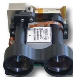
Módulo LRF-DMC que combina brújula y telómetro