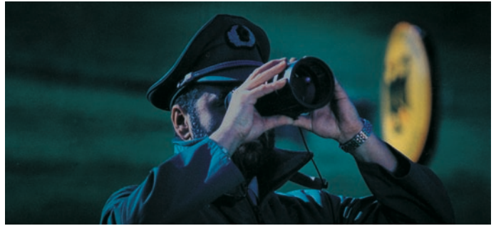
Binocular nocturno BIG35

Vectronix NiteSpot50 es un visor nocturno intensificador de luz que se presta para miras en fusiles.