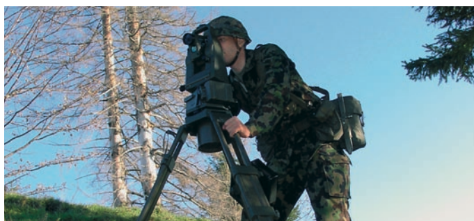
Sistema autónomo de topografía MASS

Vectronix ofrece módulos OEM para integración en sistemas de navegación personal que trabajan en zonas donde el GPS no tiene acceso. Esos módulos calculan su posición actual a base de varios sensores integrados. Además pueden ser compensados con datos entregados por un GPS externo. Dependiendo de las necesidades del usuario existen módulos con diferentes características.