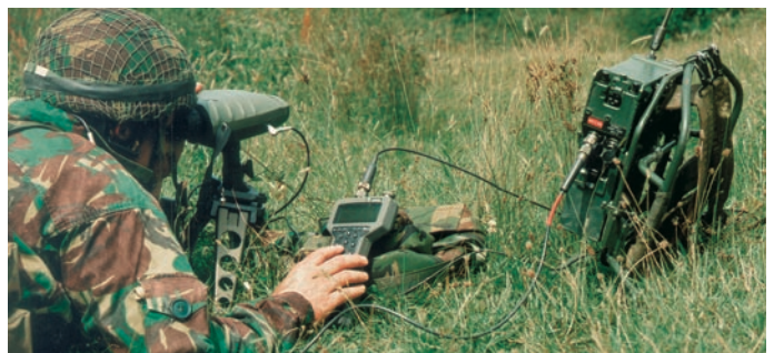
VECTOR conectado al sistema de dirección de tiro MORFIRE de Marine Air Systems (NZ) Ltd

Vectronix ofrece sistemas modulares de observación y orientación de piezas. Por lo general, estos sistemas incluyen un trípode, un goniómetro o teodolito y un telémetro. Una brújula digital o un giróscopo proporcionan la orientación. Para visión nocturna puede añadirse una cámara térmica o un intensificador de luz. Conectores electrónicos permiten la comunicación con terminales de datos, radios y receptores de GPS. Nuestro sistema de posicionamiento de piezas GLPS ("Gun Laying and Positioning System"), así como las estaciones digitales de observación basadas en el SG12, de las que existen una docena de variantes adaptadas a las necesidades de los clientes, están en servicio en unidades de artillería de numerosos países. Los últimos desarrollos de Vectronix son el GoniLight para el observador avanzado y el sistema autónomo de topografía MASS ("Military Autonomous Survey System").