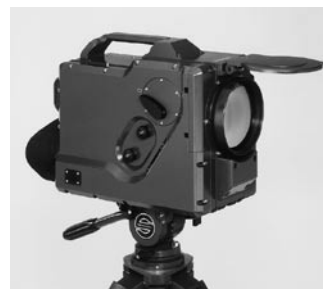
1987 Cámara térmica FORTIS Wild Heerbrugg & Siemens Albis