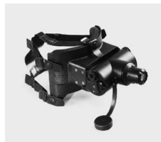
1983 Gafas de visión nocturna WILD BIG2