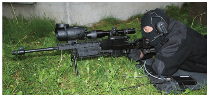
NiteSpot50 visor nocturno