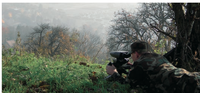
Estación digital de observación