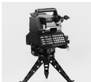
1984 Estación de observación WILD TAS10