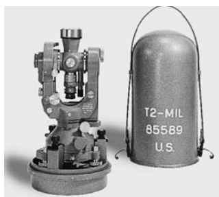
1921 Teodolito WILD T2