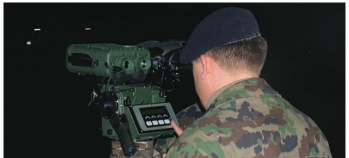
Sistema de observación y localización de objetivos del Ejército suizo

El primer sistema binocular del mundo que incorporaba funciones de medición de distancia y ángulos fue presentado por Leica en 1992. De este concepto surgió la familia de binoculares VECTOR™, de los que se han vendido más de 16.000 unidades, lo cual acredita su enorme éxito. Vectronix realiza un desarrollo continuo de esta línea de producto, mejorando sus prestaciones, incorporando nuevas funciones y ofreciendo nuevos accesorios. El tope de la gama es el VECTOR Nite, un telémetro binocular que integra intensificador de luz. En el otro extremo está el pequeño y robusto PLRF ("Pocket Laser Range Finder"), ideal para operaciones especiales y misiones urbanas.