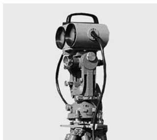
1969 Distanciómetro infrarrojo WILD D110