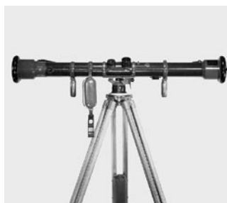
1936 Telémetro óptico WILD TM2