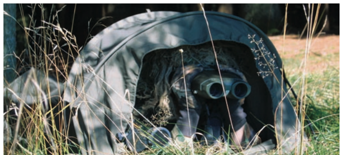
Prismático telemétrico VECTOR

La brújula magnética digital DMC ("Digital Magnetic Compass") proporciona datos de dirección e inclinación mientras que el módulo LRF ("Laser Range Finder") posibilita la medición de distancias. Vectronix utiliza los módulos DMC y LRF en muchos de sus propios productos, aunque también los vende a un selecto grupo de integradores de sistemas.