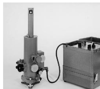
1963 Giróscopo de dirección WILD ARK1