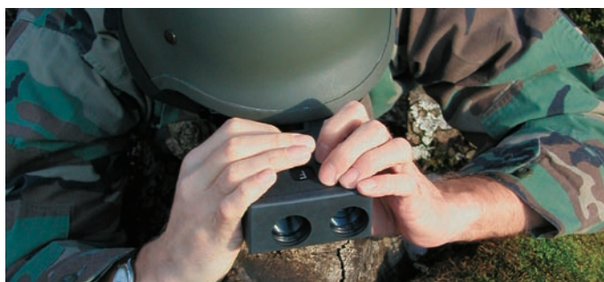
Telómetro de bolsillo PLRF